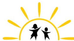
THE ILC FOUNDATION Improving the Lives of Children and Families Living with Chronic Pain